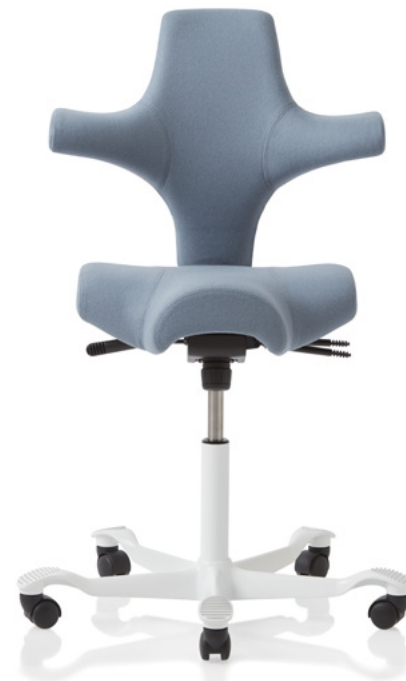
Ontwerp: Peter Opsvik. Geregistreerd en gepatenteerd model