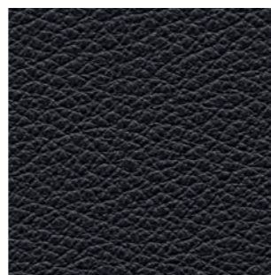
4880 schwarz 2900