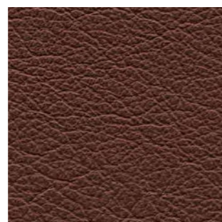
4803 dunkelbraun 2855