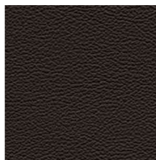
4804 kaffeebraun 2880