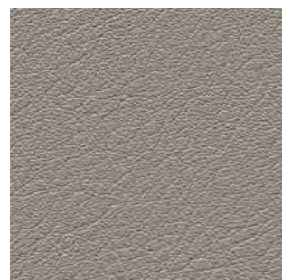
4802 hellgrau 2740