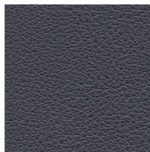
4801 dunkelgrau 2780