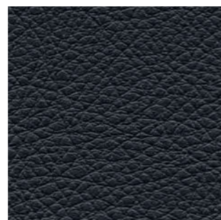
4806 dunkelblau 2580