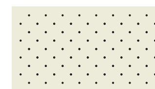
Perforation MK1 (A1)

Perforation of the leathers possible as of one hide – perforation on half hides. Price on inquiry.