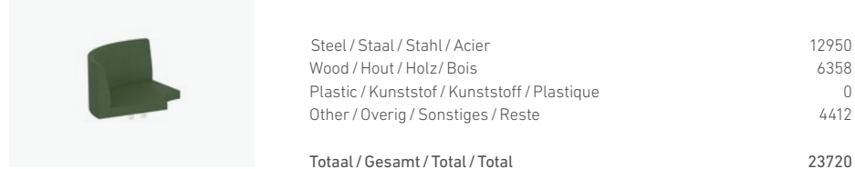
1756/99 - SEATING ELEMENT CURVE 90°