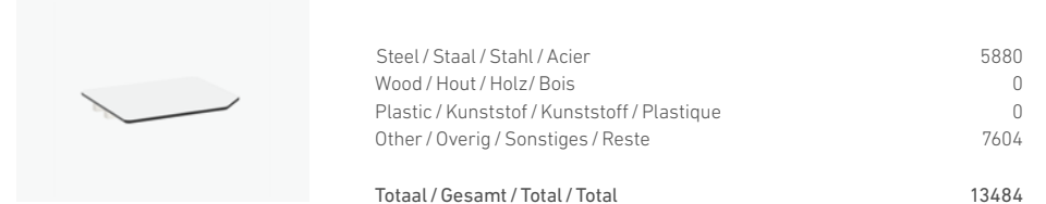
1700/75 - TABLE TOP ANGLE 90°