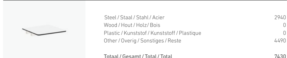
1700/73 - TABLE TOP 48X48 CM