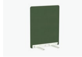
1772/99 - WALL 90 CM