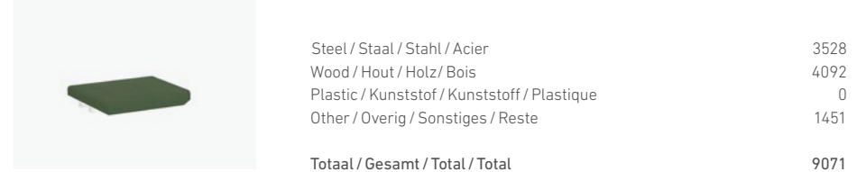
1768/99 - HOCKER ELEMENT CORNER 90°