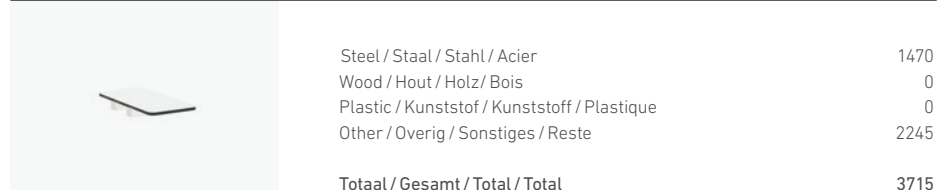
1700/72 - TABLE TOP 25X48 CM