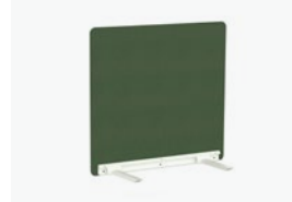
1773/99 - WALL 120 CM