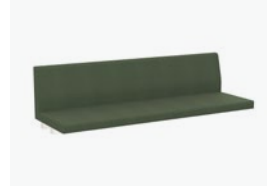
1755/99 - 180 CM