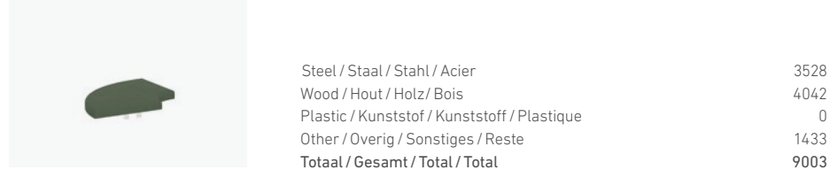
1766/99 - HOCKER ELEMENT CURVE 90°