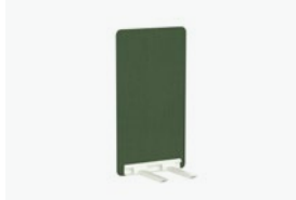
1771/99 - WALL 60 CM