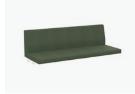
1754/99 - 150 CM