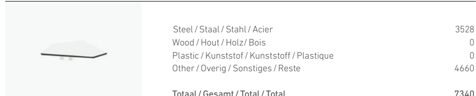
1700/74 - TABLE TOP ANGLE 45°