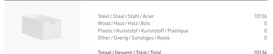
1700/62 - TRAY 25X45X20 CM