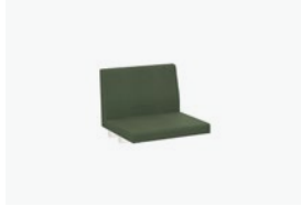
1751/99 - 60 CM