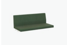
1753/99 - 120 CM