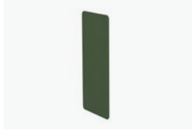
1770/99 - WALL END SIDE 60 CM