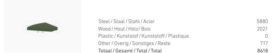
1767/99 - HOCKER ELEMENT CURVE 45°