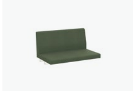
1752/99 - 90 CM