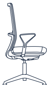
ANTEO ALU HI vergaderstoel

Deze producten worden door KÖHL aanbevolen om te combineren: